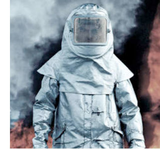
Ropa de protección