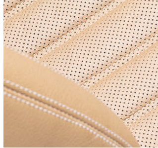
Asientos de automóviles